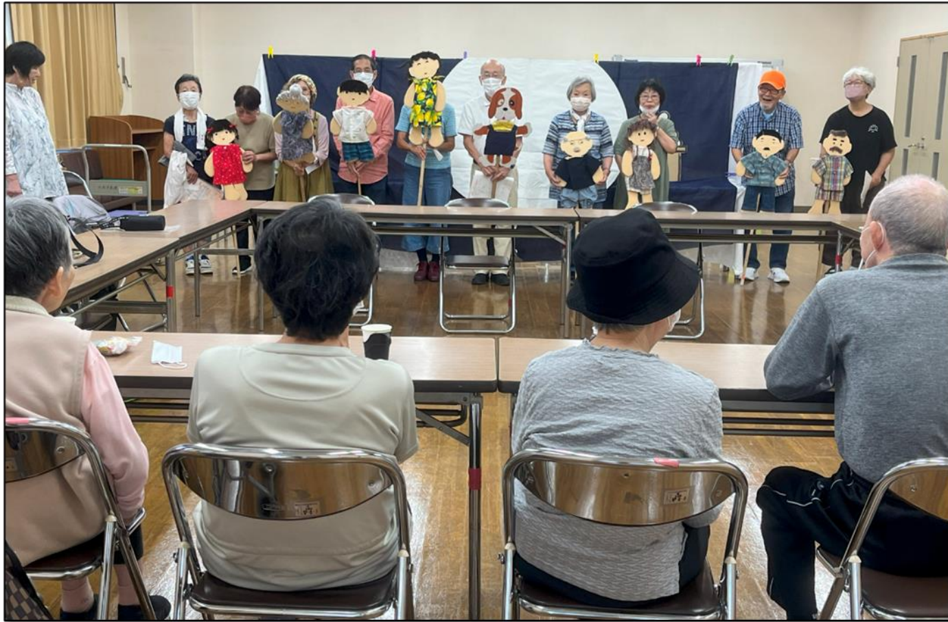
認知症カフェ参加(9月18日 なごみ庵)