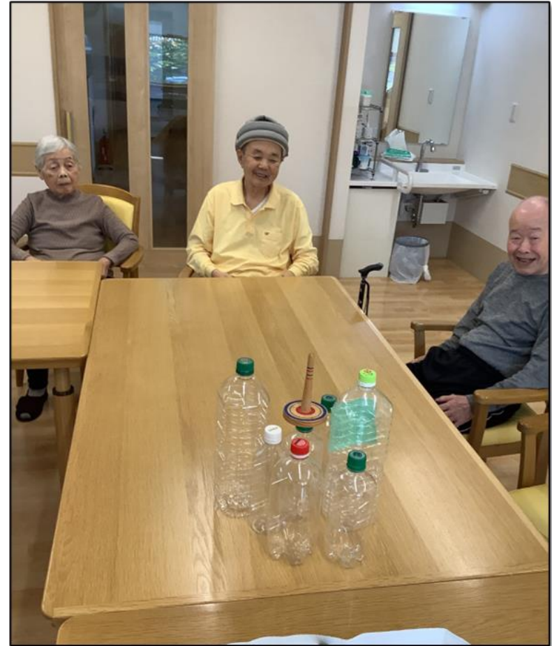
集団レクリエーション