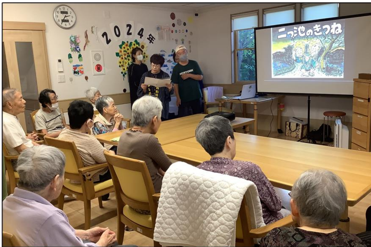
お山の杉の子さん(8月26日 電子紙芝居)